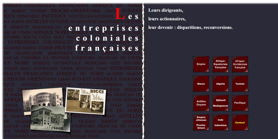
Aperçu de la page d'accueil d'entreprises-coloniales.fr

Depuis fin 2023, à l'initiative de son président, l'AECV est devenue partenaire du site web entreprises-coloniales.fr , fondé par Alain Léger. À partir de mai 2025, toutes les pages dédiées aux entreprises coloniales établies en Annam (centre du Viêt Nam) seront disponibles directement sur le site de l'AECV. Pour l'heure, les documents numérisés issus des collections de l'AECV et publiés sur entreprises-coloniales.fr sont consultables ici .