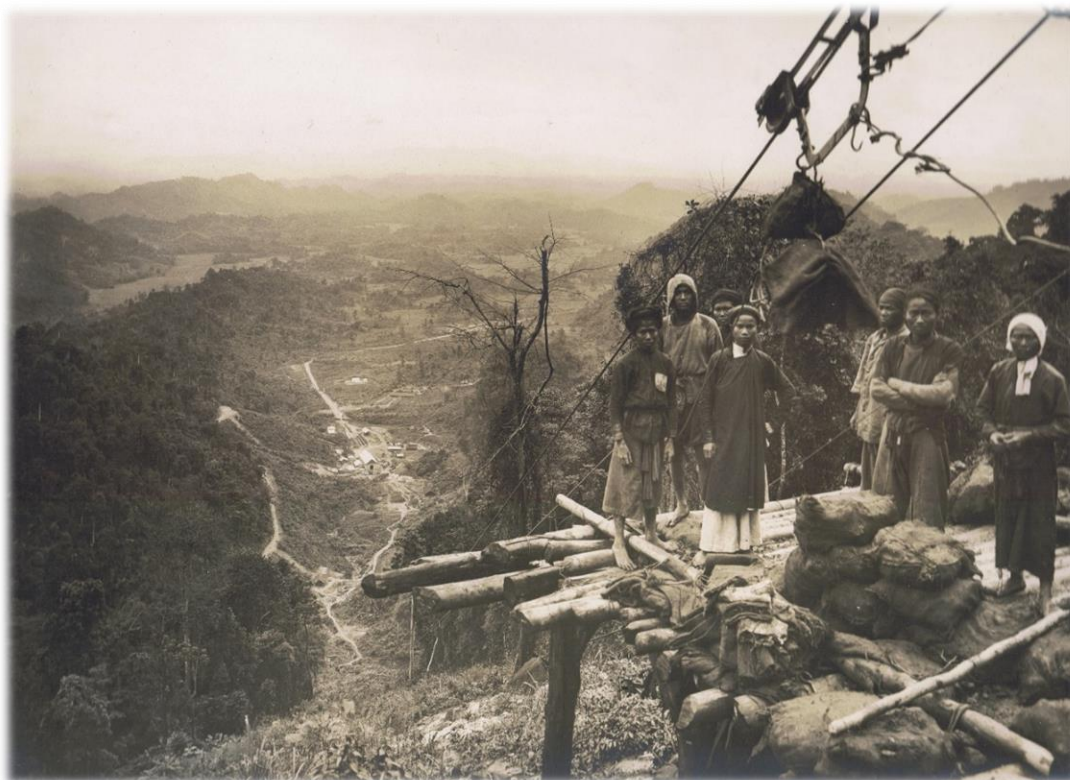
Tête du câble de Moba, mine de Lang Hitt. Photographie non datée.