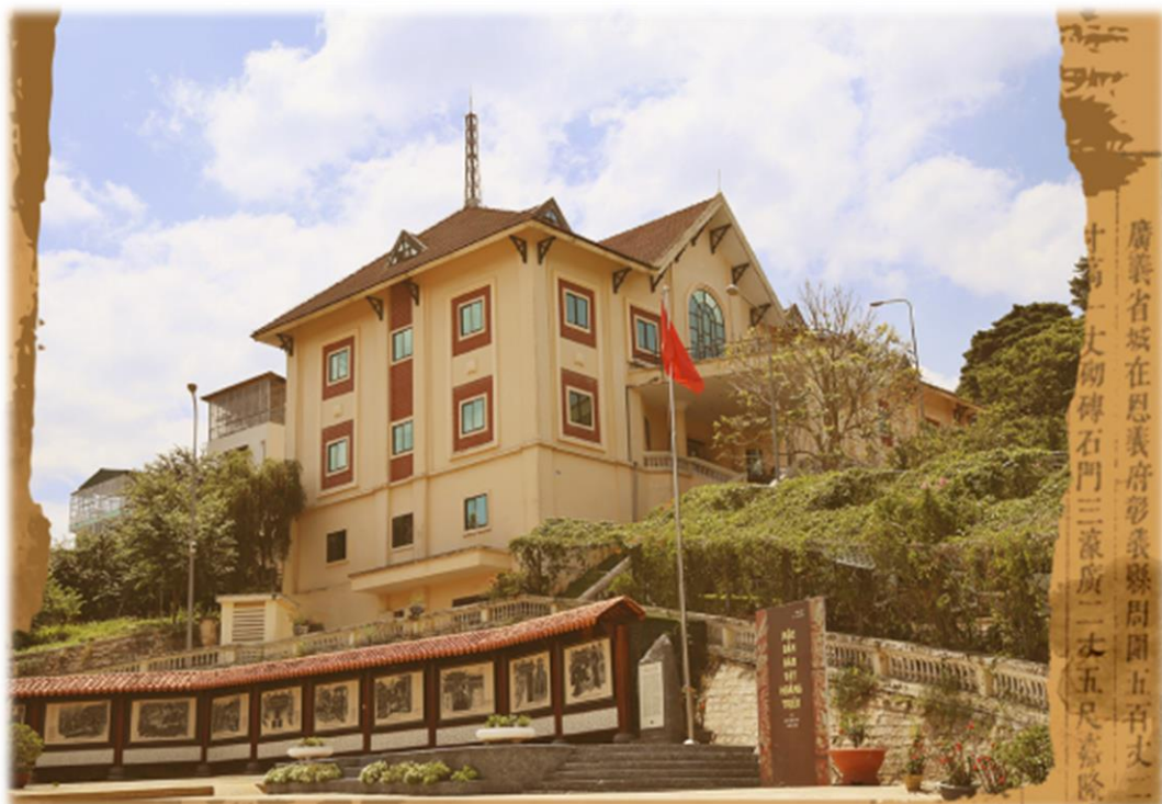
Centre No.4 des Archives nationales du Việt Nam, Đà Lạt

L'AECV entend également mettre en place un partenariat avec les Archives nationales du Việt Nam, en particulier avec le Centre No.4, situé à Đà Lạt et où sont conservées la plupart des archives administratives des provinces du centre du pays, y compris celles de la Résidence supérieure de l'Annam pour ce qui concerne la période coloniale.