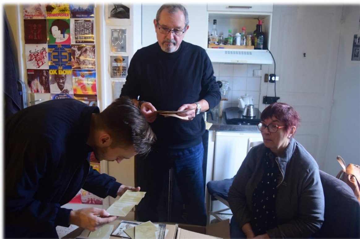
Transfert du fonds Ducreux-Seter-Barraco. Paris, 19/11/2024.

Le fonds est actuellement en cours de récolement mais les lecteurs intéressés peuvent d'ores et déjà consulter une notice historique provisoire sur notre site internet . Elle sera bientôt remplacée par un historique plus complet, accompagné d'un inventaire détaillé du fonds. À ce stade, il apparaît que les archives composant le fonds commencent à la fin du XIX e siècle et s'étendent jusqu'au milieu des années 1970. S'y trouvent principalement : des dossiers administratifs d'entreprises minières établies au Tonkin, des comptes-rendus de prospection minière, de comptabilité et des correspondances se rapportant à l'exploitation desdites entreprises minières. S'y ajoutent des témoignages de première main au sujet de l'occupation japonaise, des livres de comptes et divers documents financiers, des fascicules, de nombreuses cartes, croquis et calques et quelques photographiques originales.