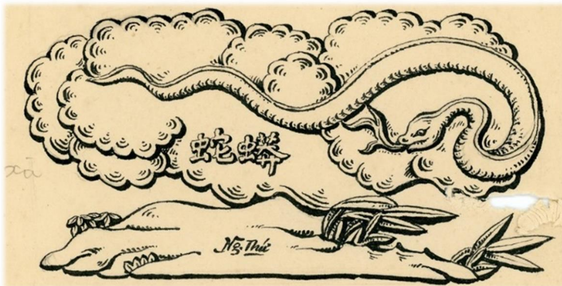
© AECV, fonds AAVH-NAAVH. Hué, c. 1914 - Dessins sur les urnes dynastiques. Le serpent.

Le bureau de l'AECV aecv.asso@gmail.com aecv-mientrung.com